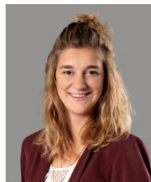
Silvana Eggenberger Versicherung