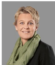
Tracey Kalberer Versicherung