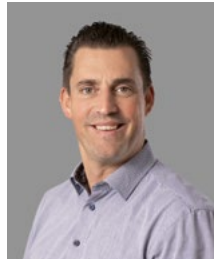
Christian Stetka Versicherung