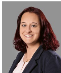
Carmen Roth Versicherung