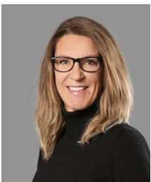
Melanie Graf Redaktion