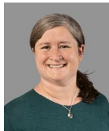
Martina Lehn Redaktion