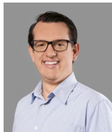
Leo Mazzanti Versicherung