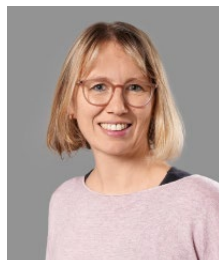
Doris Ammann Redaktion