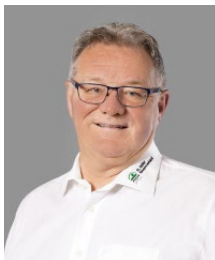
Andreas Koller Versicherung