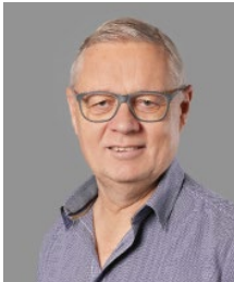
Uwe Wöcke Versicherung