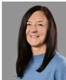
Oriana Oertig Redaktion